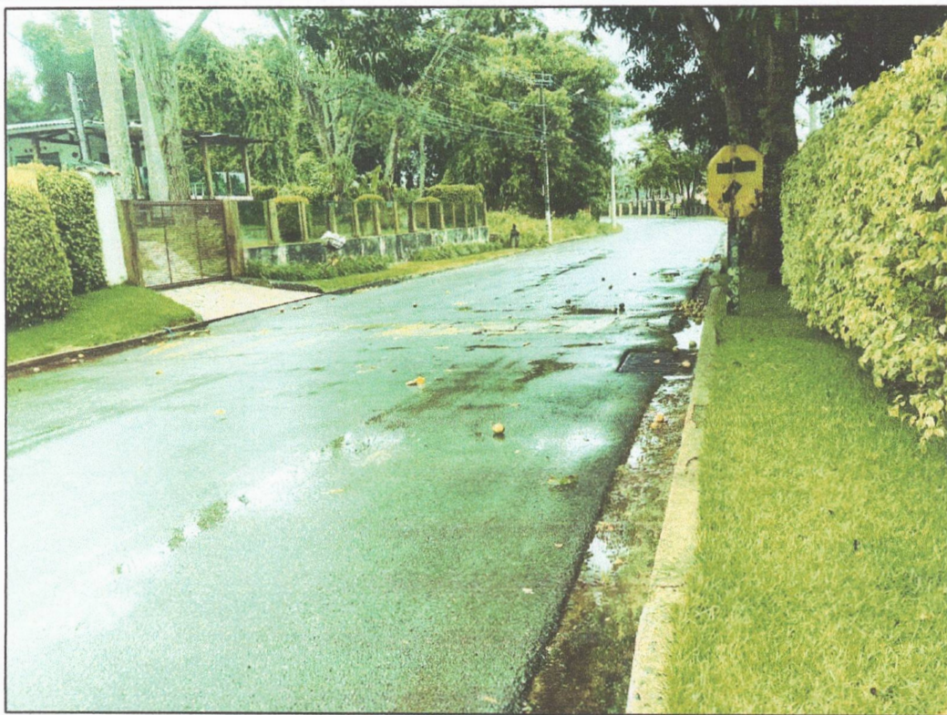
Foto 1 – Quebra-molas desgastado na Avenida dos Veleiros, bairro Escarpas do Lago